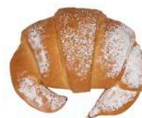
ROGALIK PÓŁFRANCUSKI Z NADZIENIEM 100g