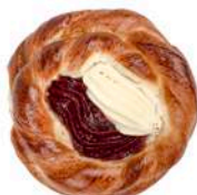
DROŻDŻÓWKA Z SEREM I MARMOLADĄ 100g