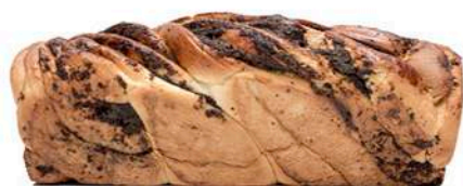
PLACEK DROŻDZOWY Z MAKIEM