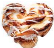
DROŻDŻÓWKA Z SEREM 100g