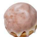
MINI PĄCZEK Z MARMOLADĄ 50g