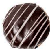
PĄCZEK Z CZEKOLADĄ 80g