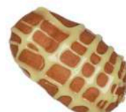
PĄCZEK Z ADWOKATEM 50g