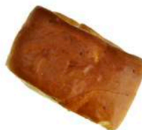
DROŻDŻÓWKA Z PRL'U Z SEREM 100g