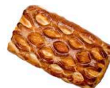
DROŻDŻÓWKA PÓŁFRANCUSKA Z MORELĄ 100g