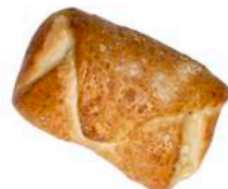
DROŻDŻÓWKA Z JABŁKIEM 100g