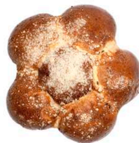
STOKROTKA DROŻDŻOWA 360g