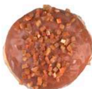
PĄCZEK Z MARMOLADĄ 80g