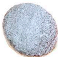
PĄCZEK Z JABŁKIEM 100g