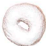
DONUT Z CUKREM PUDREM 70g