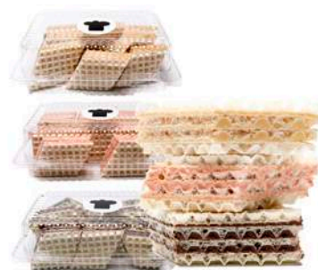
WAFLE O SMAKU TOFFI / TRUSKAWKA / CZEKOLADA