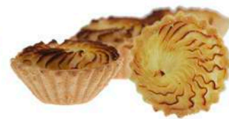
BABECZKA Z BUDYNIEM