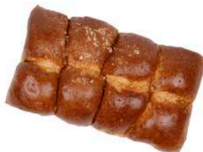
PLACEK DROŻDŻOWY 250g