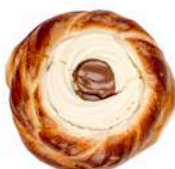
DROŻDŻÓWKA Z SEREM I TOFFI 100g