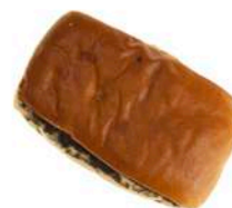
DROŻDŻÓWKA Z PRL'U Z MAKIEM 100g