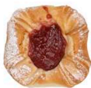
DROŻDŻÓWKA PÓŁFRANCUSKA Z MARMOLADĄ 100g