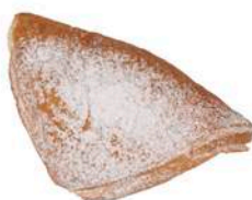
DROŻDŻÓWKA PÓŁFRANCUSKA Z JABŁKIEM 100g