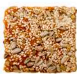
CIASTO ORKISZOWE KOSTKA Z CZEKOLADĄ lub TOFFI