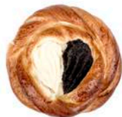
DROŻDŻÓWKA Z SEREM I MAKIEM 100g