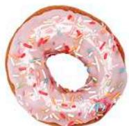
DONUT Z LUKREM 70g