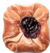
DROŻDŻÓWKA PÓŁFRANCUSKA Z WIŚNIĄ 100g