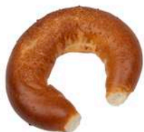
ROGAL DROŻDŻOWY 80g