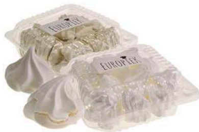
BEZY KLASYCZNE / KAWOWE