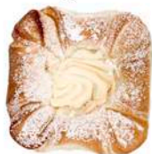
DROŻDŻÓWKA PÓŁFRANCUSKA Z SEREM 100g