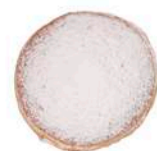
MINI PĄCZEK Z MARMOLADĄ 50g