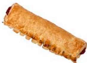
DROŻDŻÓWKA FRANCUSKA Z MARMOLADĄ 100g