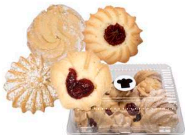
CIASTKA KRUCHE MIX