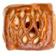
DROŻDŻÓWKA PÓŁFRANCUSKA Z SEREM I MARMOLADĄ 100g