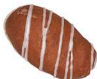
PĄCZEK Z BITĄ ŚMIETANĄ 50g